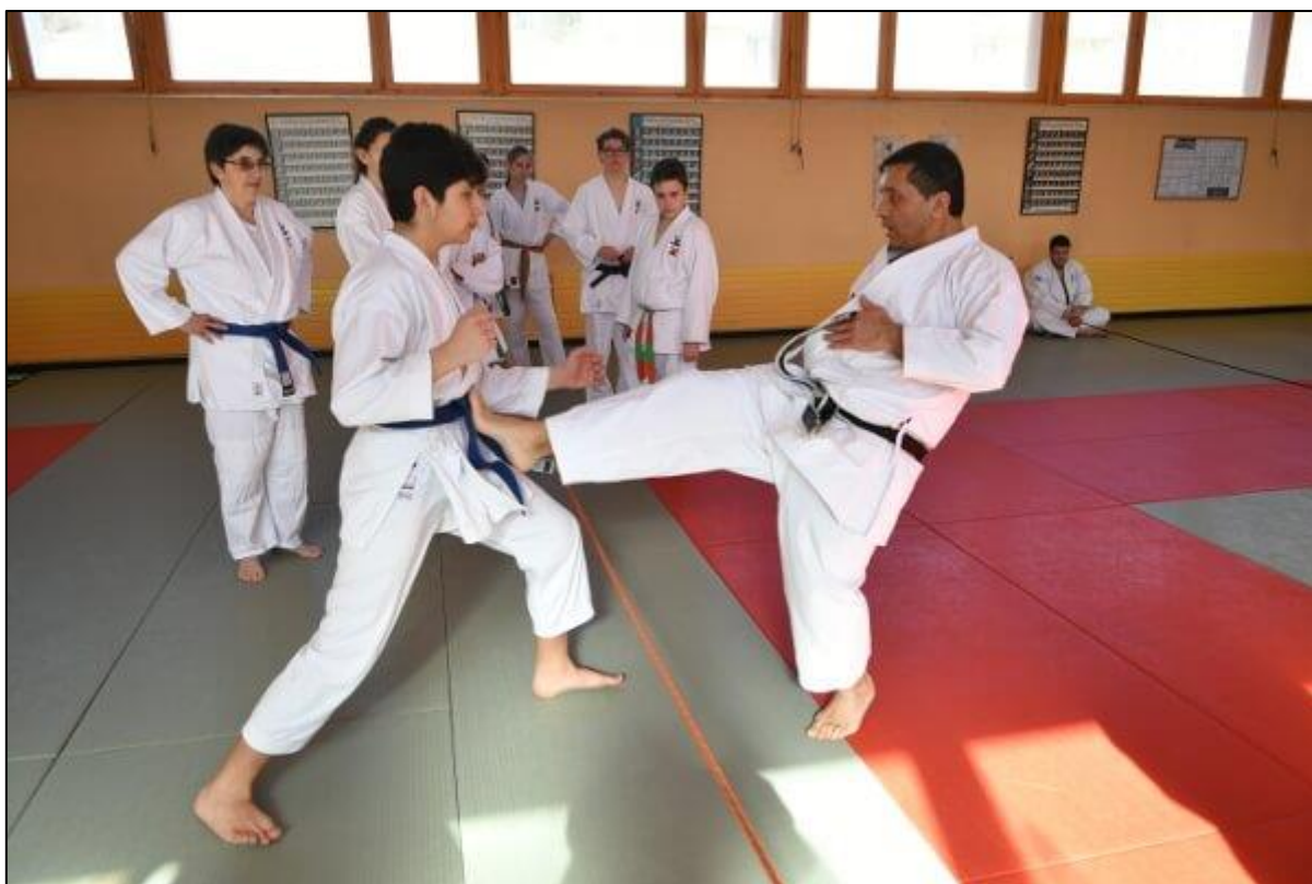
Devrani explique comment il faut frapper avec le pied.

Fin février, le stage SHIRO du Club Juniors a rencontré un franc succès. Cette édition réunissait les sections Judo et Karaté pour le week-end.