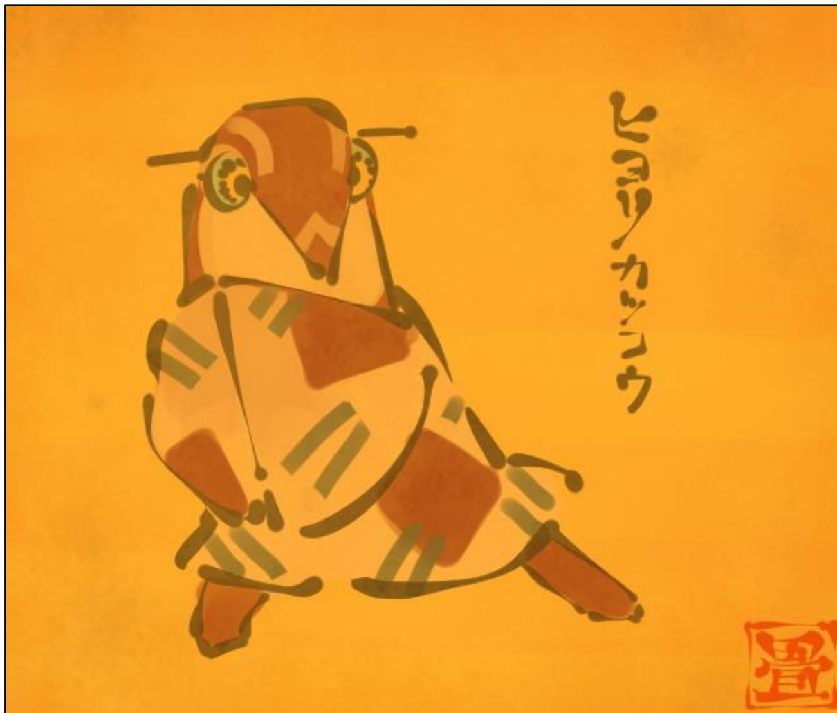
Représentation d'un yōkai par @tatami111.

Sur Twitter, j'apprécie le travail de @tatami111 , un artiste japonais dont la galerie vaut le coup d'œil. Amateurs du monde des yōkai (fantômes et créatures surnaturelles) et de traditions, partisans de nourriture revisitée et d'objets détournés, vous allez y perdre vos dimanches ! Retrouvez son site Internet http://obakemiti.sakura.ne.jp/ (en japonais) et osez cliquer pour vous balader !