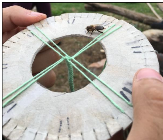
Une abeille s'invite sur le disque de tissage en carton.

Vous aimez utiliser vos mains ? Cédez à l'art du kumihimo et apprenez à tisser comme le font les Japonais depuis plusieurs siècles ! Pour débiter, je conseille le site http://friendship-bracelets.net qui regorge de tutoriels sur la confection de bracelets. Faites quelques recherches et vous tomberez sur les explications de la technique Kongō gumi, la plus facile pour commencer. Ou encore plus simple, demandez au rédacteur de ces lignes !